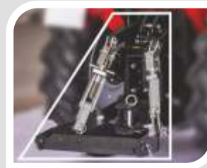
Robustes 3- Punkt-Gestänge