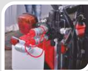
Umwandelbares einfach- /doppeltwirkendes Steuerventil